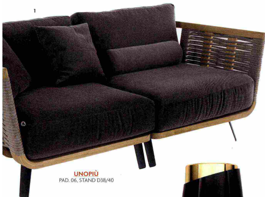
UNOPIÙ PAD. 06, STAND D38/40