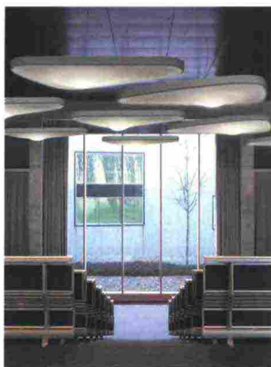
IGUZZINI ILLUMINAZIONE VIEW design iGuzzini e Arup

Proiettore compatto dal design fluido ed essenziale, interpreta il valore della semplicità e dell'eleganza lineare, racchiudendo in un unico volume i componenti tecnici più avanzati. Corpo in pressofusione di alluminio, pensato per impiegare la tecnologia Opti linear, con un riflettore in alluminio superpuro anodizzato per illuminare le superfici verticali con un'eccellente uniformità, con ottiche wide flood e wall washer.