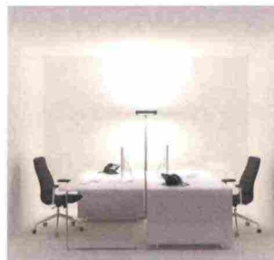
OSRAM FUTUREL 5MS LED

Innovativo apparecchio a stelo dal design essenziale e dalla tecnologia all'avanguardia per uffici e interni moderni. Struttura microprismatica che consente la distribuzione omogenea di una luce diretta e alta, senza riflessi, per un buon comfort visivo. Dispone di sensore di movimento e di rilevamento luce naturale. Può essere integrato in un sistema domotico grazie al Lightify Pro.