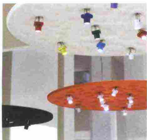
ARTEMIDE NAÒS design Carlotta de Bevilacqua

Una superficie con proprietà di assorbimento del suono sostiene 12 elementi LED orientabili: un sistema brevettato che garantisce la massima flessibilità nella gestione della luce attraverso piccoli spot che, con un giunto sferico, si connettono alla superficie permettendo di orientare un fascio di 30°. Questa soluzione consente di modellare un illuminamento uniforme e confortevole in un'area di 1 mq definendo una territorialità percettiva sostenuta dal controllo acustico.